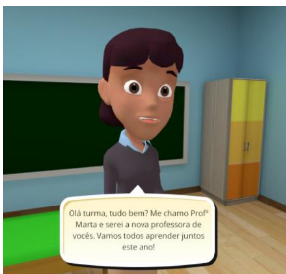
Figura 1. Tela de apresentação ao personagem.

Considerando as práticas educativas multimodais, Schlemmer e Lopes (2016) destacam que elas podem apresentar-se de diferentes modos, podendo ser presencial ou modalidade online . Nesse sentido, este jogo caracteriza-se como multimodal, possibilitando seu acesso através do uso em dispositivos móveis, desktop , tanto em modo online como offline . As figuras 1 e 2 demonstram algumas das telas que aparecem ao jogador durante o capítulo 1.