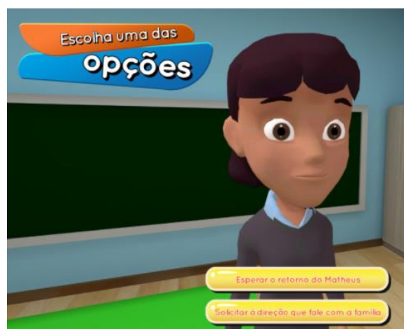
Figura 2. Tela indicando que o jogador deve fazer uma escolha.