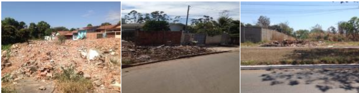
Figura 10: Entulho lançado em áreas de preservação, calçadas e obstruindo rua.

Há vários bairros infestados de disposições irregulares, principalmente os setores pouco habitados, alguns com diversos pontos de descarte em uma mesma rua. Também se identificou pontos em áreas de preservação ambiental, próximos a mananciais e recuperação de erosões.