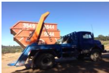
Figura 7: Transporte de caçambas.

A função da transportadora é assegurar que os resíduos de classe A sejam transportados e depositados em locais adequados. Mas, na prática, às vezes pode acontecer de serem despejados em locais irregulares, principalmente quando é negada sua disposição pelos recebedores, por conter resíduos contaminados.