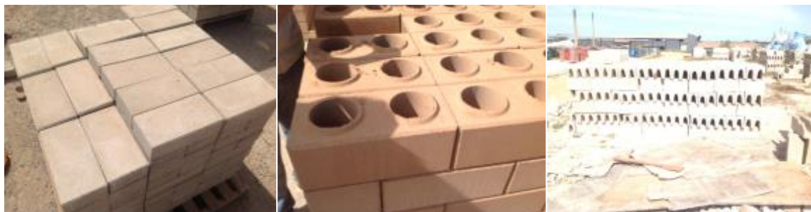
Figura 8: Artefatos produzidos.

Os artefatos produzidos podem ser utilizados em estruturas, alvenarias, vigas, pavimentação de pátios, muros e outros.