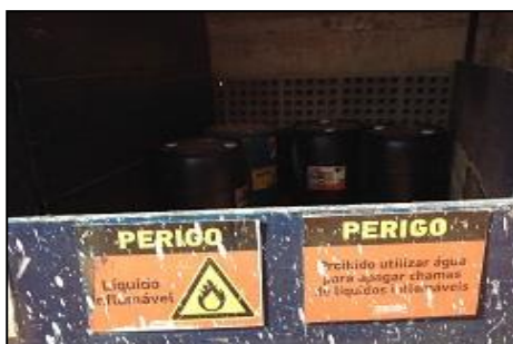
Figura 5: Segregação de resíduos perigosos.

Os resíduos de classe D são: tintas, vernizes, solventes, óleos, impermeabilizantes e os demais materiais e ferramentas (figura 5). São utilizados na pintura e considerados resíduos perigosos, conforme a Resolução 307 do CONAMA.