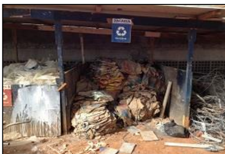
Figura 4: Resíduos de sacarias (falta de tecnologia para reciclagem).

Apesar das dificuldades encontradas para a destinação de sacarias, algumas obras fazem a segregação desse resíduo com destino incerto, mas, geralmente, direcionado ao Aterro Sanitário de Goiânia. Verificou-se, também, que, em algumas obras, adota-se a prática da incineração para ficarem livres da sacaria acumulada no canteiro de obra.