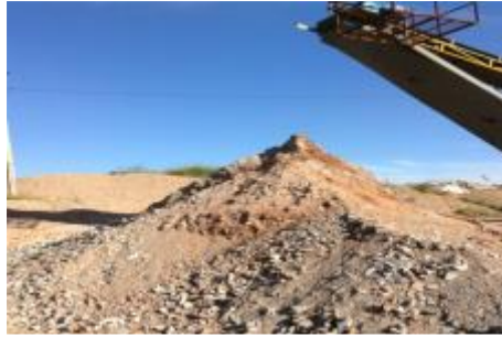
Figura 9: Agregados produzidos por reciclagem.

Os materiais produzidos por ambas as recicladoras têm aplicações distintas, o que demonstra o grande potencial do processo de reciclagem dos resíduos da construção civil, inserindo novamente os materiais no ciclo completo da cadeia produtiva do novo-velho-novo.