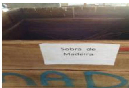
Figura 3: Resíduos segregados de classe B (restos de madeiras)

Os resíduos da madeira (figura 3) também se tornaram um gargalo na gestão de cadeia dentro do processo construtivo, devido à falta de interesse pela reutilização e reciclagem. Isso influencia as construtoras a recorrerem a alternativas que lhes pareçam mais fáceis, a exemplo da disposição irregular, a queima pela própria empresa, ou ainda, deixar de fazer sua triagem e misturá-los aos demais resíduos, que são colocados nas caçambas das transportadoras, a fim de se verem livres dos problemas.