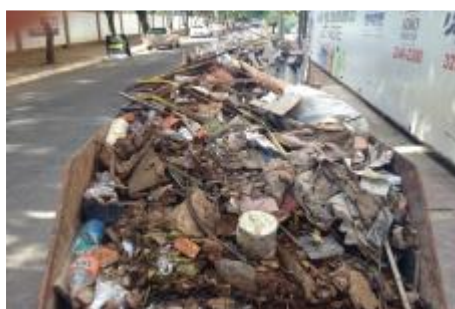
Figura 6: Resíduos de diversas classes misturados.

Na prática, a segregação desses resíduos é realizada apenas em algumas das obras pesquisadas, as quais também encontram dificuldades na sua destinação. Enquanto outras não os separam e misturam-nos aos resíduos de outras classes, perdendo a qualidade para reciclagem, sendo desperdiçados, além de se tornarem suscetíveis à contaminação do meio ambiente (figura 6).