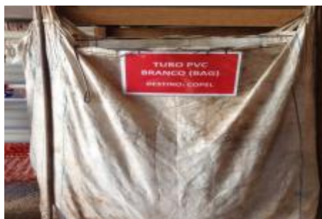
Figura 2: Resíduos segregados de classe B (PVC).

O metal tem grande potencial de reciclagem e interesse de empresas especializadas que atuam há vários anos nesse ramo, pois possui valor comercial e, segundo dados obtidos junto aos canteiros de obras pesquisados, o valor apurado na sua comercialização geralmente é revertido em algo que beneficie aos próprios empregados das obras. Porém, constatou-se que alguns dos canteiros de obras ainda não fazem a segregação.