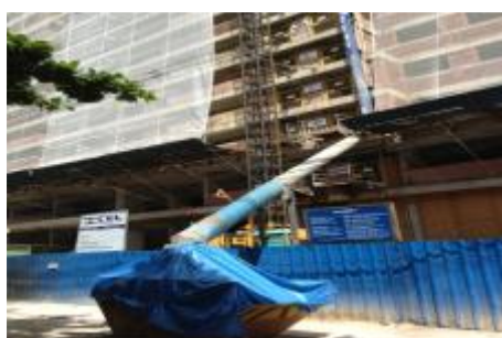
Figura 1: Disposição de RCD classe A direto na caçamba.

Os resíduos de classe A são: tijolo/cerâmico, argamassa, cimento, blocos de concreto, concreto, cerâmica e revestimento (figura 1). Eles são o maior responsável pelo grande volume, peso e variedade do material de resíduos sólidos gerados nos canteiros de obras, sendo o maior gargalo para as construtoras.