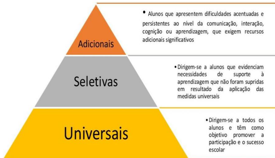
Figura 1 – Abordagem Multinível de Acesso ao Currículo

Com o intuito de melhor esclarecer os sistemas escolares e a respetiva classe docente sobre o carácter multinível desta nova abordagem de acesso ao currículo, o Ministério da Educação organizou as novas medidas em pirâmide, numa escalada explícita que parte do coletivo para as situações particulares que exigem da comunidade educativa uma resposta especializada (Figura 1).